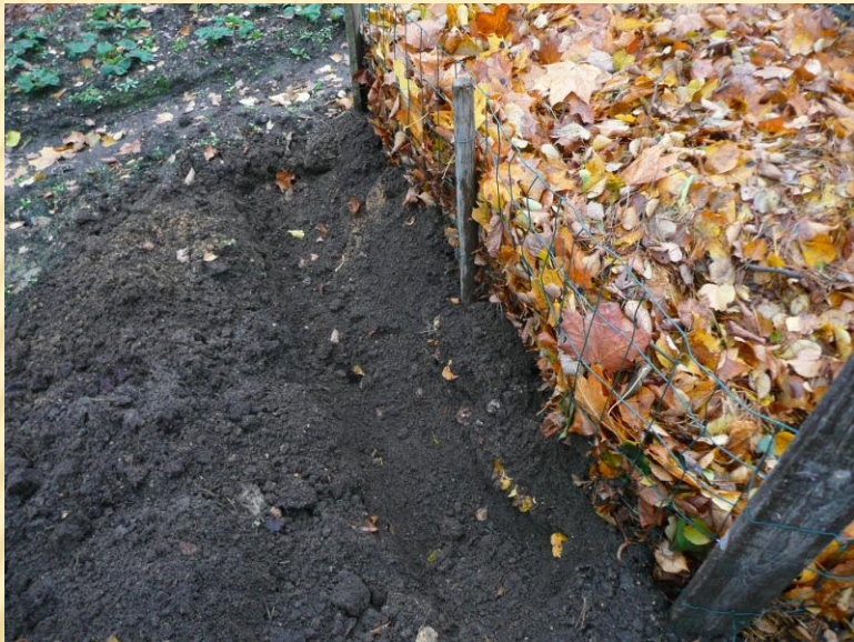
Šalia užuovėjos kasama tranšėja